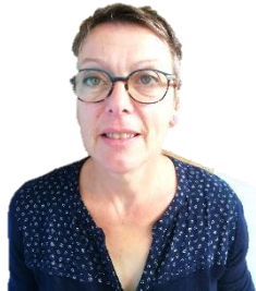
PELE Chantal ASEM en TPS PS